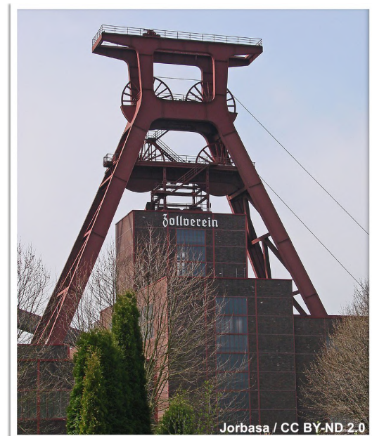
Der Industriekomplex Zeche Zollverein in Essen ist ein Industriedenkmal und seit 2001 UNESCO-Welterbe.

Die Seite der deutschen UNESCO-Kommission auf Deutsch und Englisch. Hier findet ihr eine Liste mit allen Welterbestätten Deutschlands. https://www.unesco.de/kultur-und-natur/welterbe https://www.unesco.de/en/culture-and-nature